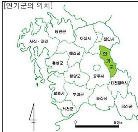
〈 연기군의 위치 〉

경부선 철도와 국도 1호선이 관통하고 충북선 철도의 시발점이며 경부·중부 고속도로와 인접한 연기군은 사통팔달의 편리한 교통망으로 어느 지역과도 쉽게 연결될 수 있다.