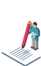
대학교 학업학기 Academic Study