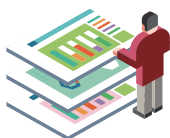
산업현장 실습학기 Work Experience